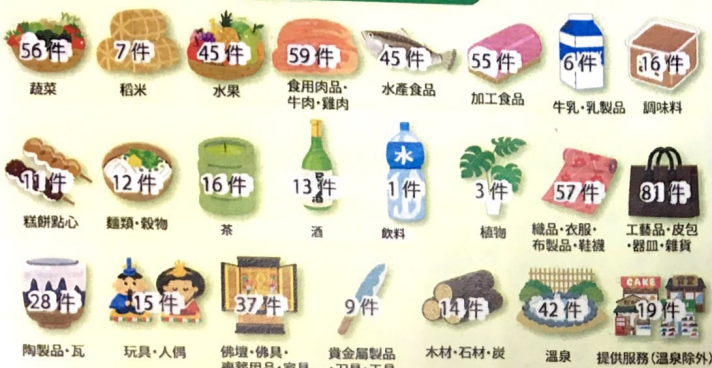
註冊產品別件數一覽表

取得註冊之商品及服務類別及件數。 地域團體商標制度,自2006年4月起實施,制度施行以來,日本全國計有600件地域團體商標取得登記註冊(截至2017年2月底)